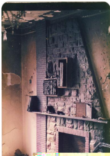
مجموعه آثار دکتر یزدی □ ۳۶۵