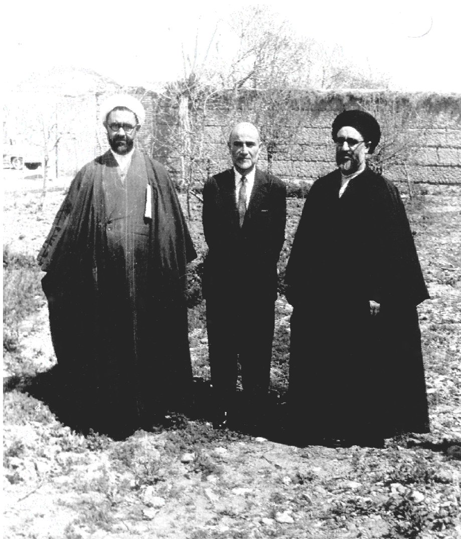
مراسم جشن عید فطر انجمن اسلامی دانشجویان دانشگاه تهران، در گلشهر کرج - سال ۱۳۳۷ (مرحوم آیت الله طالقانی، مرحوم مهندس بازرگان، شهید استاد مطهری)